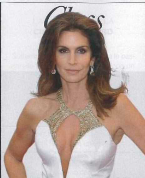
LA SUPERMODELLO CINDY CRAWFORD