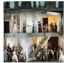
Il "Don Giovanni" di Mozart nelle sale in diretta dal Covent Garden

Da Londra il Don Giovanni diretto da Nicola Luisotti