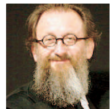
L'architetto e designer Michele De Lucchi tra gli ospiti di "5x15"

De Lucchi e Castellano al Circolo Filologico